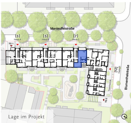
Lage im Projekt