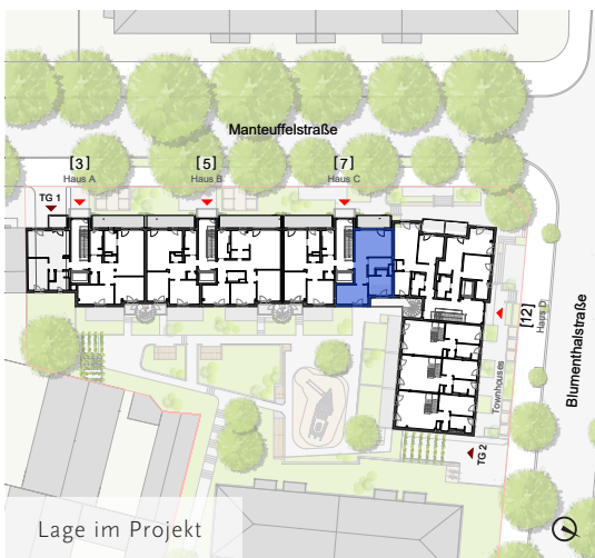
Lage im Projekt